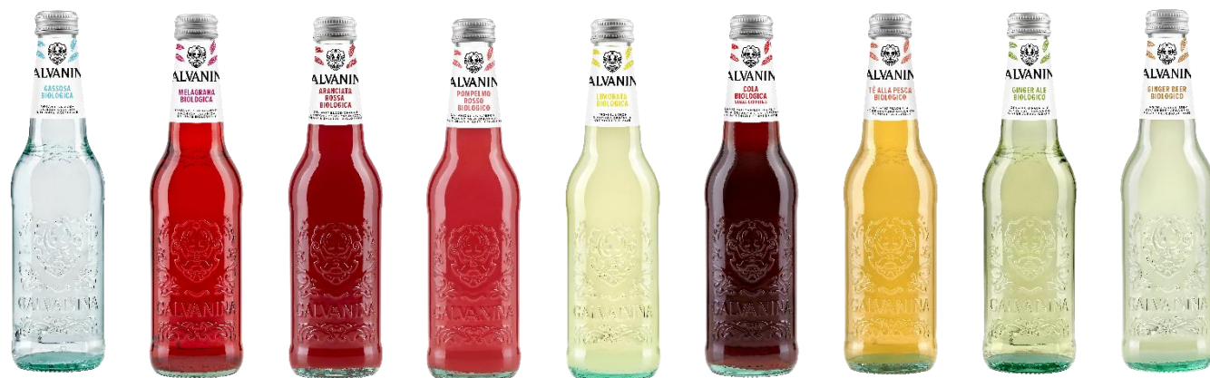
Format 355 ml