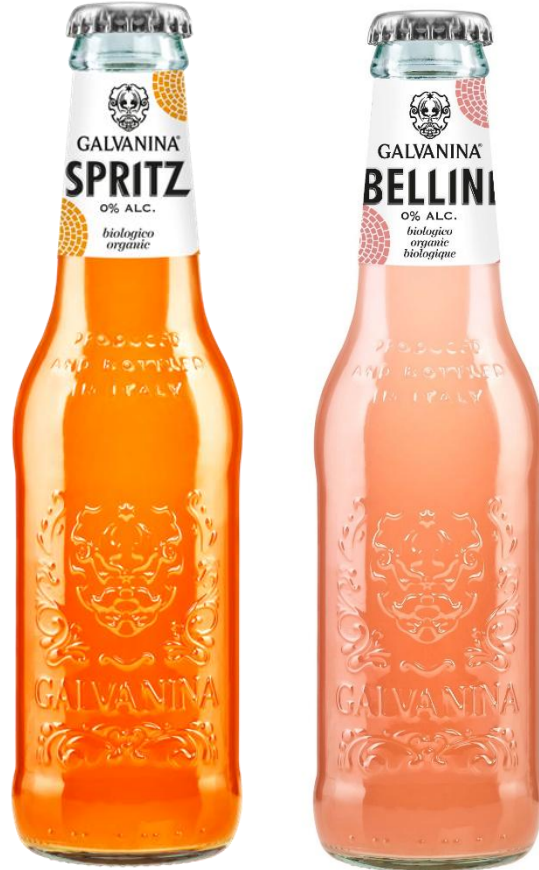
Format 200 ml