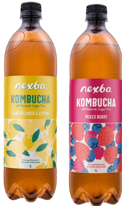
Format 1 L